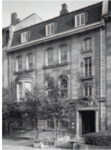
Das Haus der Stiftung in der Malkastenstraße